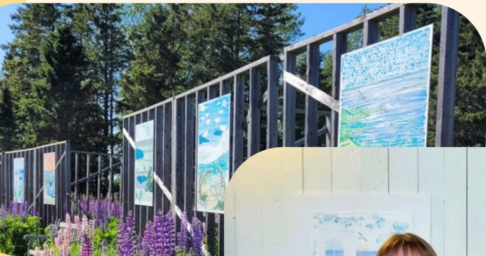
Exposition littéraire Fleuve en mémoire présentée du 28 juin au 5 octobre aux Jardins de Métis sur la Palissade du pré fleuri et à la Maison de la culture du Château landry